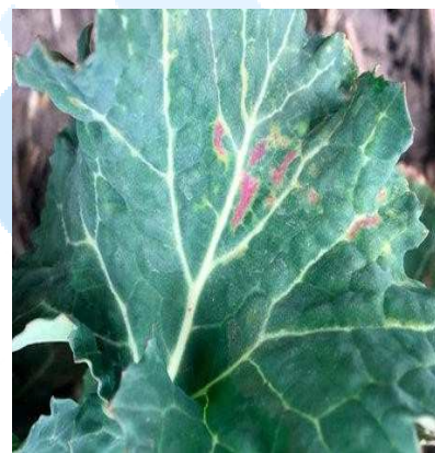
Нестача бору на молодих листках

Уніфлор Б® – 2-3 л/га та Уніфлор БМо® – 1-2 л/га на кислих ґрунтах з недостатньою кількістю молібдену.