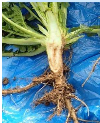
Розріз стебла в зоні кореневої шийки