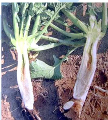
Типові поздовжні тріщини при нестачі бору